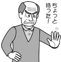
イラストは 市長のお顔ではありません

6月25日の北総鉄道の株主総会で、板倉印西市長が私たちの気持ちをそのままぶつけてくれました。主な質問を紹介します。なお北総社長の答えは裏面をごらんください。